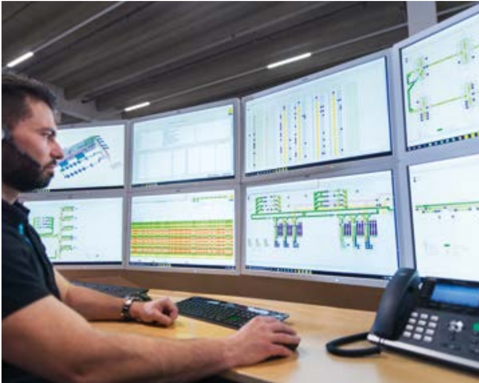
← Leitstand mit psb selektron WMS und selektron SCADA zur Steuerung und Überwachung der Intralogistik-Anlage

Für das Projekt bei api hat psb ein Konzept für Kombi-Arbeitsplätze entwickelt, an denen der Betreiber den Wareneingang und die Verpackung abwickelt. Zu Tagesbeginn übernehmen nahezu alle Arbeitsplätze die Funktion des Wareneingangs. Je näher das Ende der Bestellannahme bzw. der Cut-off-Zeiten kommt, desto mehr Arbeitsplätze setzt api für die Verpackung ein. Die maximale Versandleistung der 56 Kombi-Arbeitsplätze liegt dann bei 1.400 Paketen pro Stunde. Mit der Doppelnutzung und damit der Reduzierung der Anzahl an Arbeitsplätzen verringert psb den Platzbedarf und senkt die Realisierungs- und Nutzungskosten.